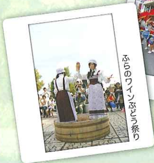
ふらのワインまつり祭り