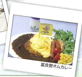
富良野オムカレー