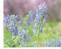
エゾエンゴサク (第2話タイトル) 花言葉 妖精たちの秘密の舞踏会