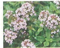
タイム (第3話タイトル) 花言葉 待機する悪女予備軍