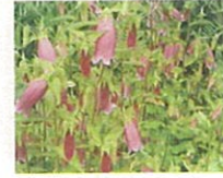
カンパニュラ (第5話タイトル) 花言葉 花壇の小人の禿かしの帽子