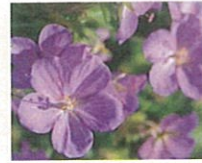
ゲラニウム (第4話タイトル) 花言葉 大天使ガブリエルの哀しいあやまち