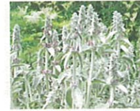
ラムズイヤー (第9話タイトル) 花言葉 生まれたばかりの孫の耳たぶ