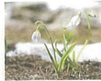
スノードロップ (第1話タイトル) 花言葉 去年の恋の名残りの涙

「北の国から」で知られる脚本家・倉本聰がフジテレビ開局50周年記念として富良野を舞台に書き下ろしたドラマ「風のガーデン」。死を目前にした主人公が絶縁していた家族のもとへ戻ってゆく物語を通し、“生きること・死ぬこと”が描かれた作品。(2008年10月～12月、11話放送)