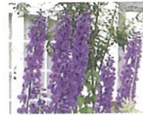
デルフィニウム (第6話タイトル) 花言葉 天使ガブリエルの薔いマント