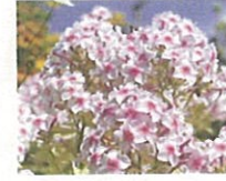
フロックス (第8話タイトル) 花言葉 妖精たちの新盆の迎え火