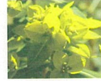
ユーフォルビア (第10話タイトル) 花言葉 乙女の祈り