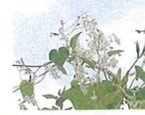
ナツユキカズラ (第11話タイトル) 花言葉 今年の冬に降る雪の雪