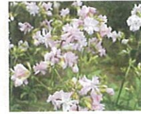
サボナリア (第7話タイトル) 花言葉 風呂上りの若妻