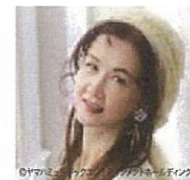
中島 みゆき シンガーソングライター