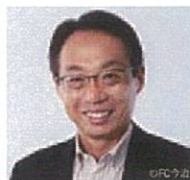
岡田 武史 元コンサドーレ札幌監督/ 株式会社今治、夢スポーツ 代表取締役