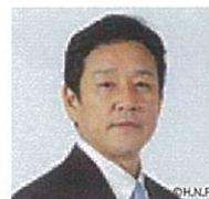
栗山 英樹 北海道日本ハムファイターズ 監督