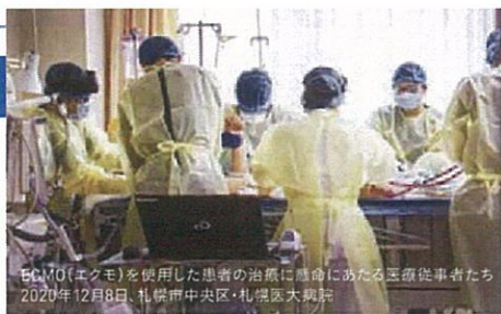
ECMO(エクモ)を使用した患者の治療に懸命にあたる医療従事者たち 2020年12月8日、札幌市中央区・札幌医科大学

■振込口座 北洋銀行 普通口座 □お取扱店:本店営業部 □店番:028 □口座番号:7004295 □口座名:「医療従事者応援プロジェクト 結」(イリョウジュウジヤウエンプロジェクト ユイ) *振込手数料はお客様のご負担になっております。寄付金は税法上の控除対象にはなりません。